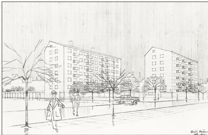
Så här kommer de båda sjuvåningsfastigheterna på Rudsvägen att ta sig ut.

Rudsvägen i Karlstad får inom en snar framtid sjuvåningsbebyggelse. I augusti månad sätter man nämligen igång med två större bostadsfastigheter i denna höjd i kvarteret Affärsmannen. Sammanlagt kommer de att rymma 59 lägenheter och åtta affärslokaler. I kvarteret blir det dessutom två garagelängor, som skall sammanbinda fastigheterna. Inflyttningsklara beräknas bostäderna bli under hösten 1957.